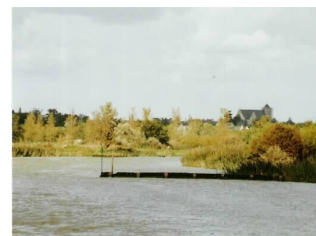
Bras de Cordemais marque latérale tribord

Vous entrez maintenant dans le bras de Cordemais (quelques marques "latérales" à l'entrée du bras). Naviguer plutôt sur bâbord, vitesse limitée 5 nœuds. Malgré la marée montante, un léger courant contraire peut se faire sentir. Les fonds sont constitués d'une épaisse couche de vase très fluide. La hauteur d'eau à mi-marée est d'environ 3.0 m, soit une hauteur suffisante pour venir au port si l'on était à l'étale de basse mer à l'entrée de la Loire.