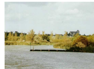
Bras de Cordemais marque latérale tribord

Vous entrez maintenant dans le bras de Cordemais (quelques marques "latérales" à l'entrée du bras). Naviguer plutôt sur bâbord, vitesse limitée 5 nœuds. Malgré la marée montante, un léger courant contraire peut se faire sentir. Les fonds sont constitués d'une épaisse couche de vase très fluide. La hauteur d'eau à mi-marée est d'environ 3.0 m, soit une hauteur suffisante pour venir au port si l'on était à l'étale de basse mer à l'entrée de la Loire.